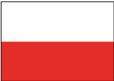
Flaga państwowa RP

Hierarchii tej należy przestrzegać na zewnątrz i wewnątrz budynków lub obiektów sportowych. Z wymienionymi flagami nie wolno eksponować flag reklamowych.