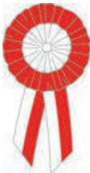
Kokarda narodowa ze wstążką

Barwy narodowe różnią się od flagi państwowej RP tym, że nie mają określonych proporcji. Mogą być dowolnej długości i szerokości trzeba jednak pamiętać, że szerokość obu pasów musi być równa . Przykładem są kokardy narodowe.