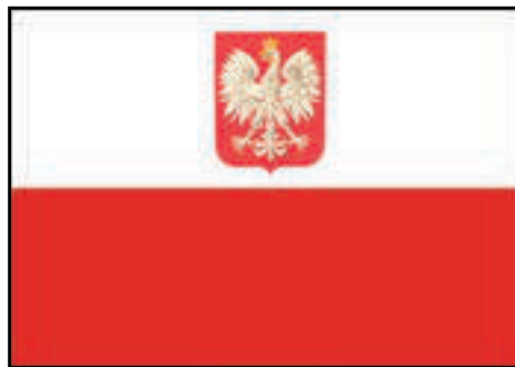
Flaga państwowa z godłem

Jeśli eksponuje się na masztach więcej flag, flagę państwową RP podnosi się (wciąga na maszt) jako pierwszą i opuszcza jako ostatnią.